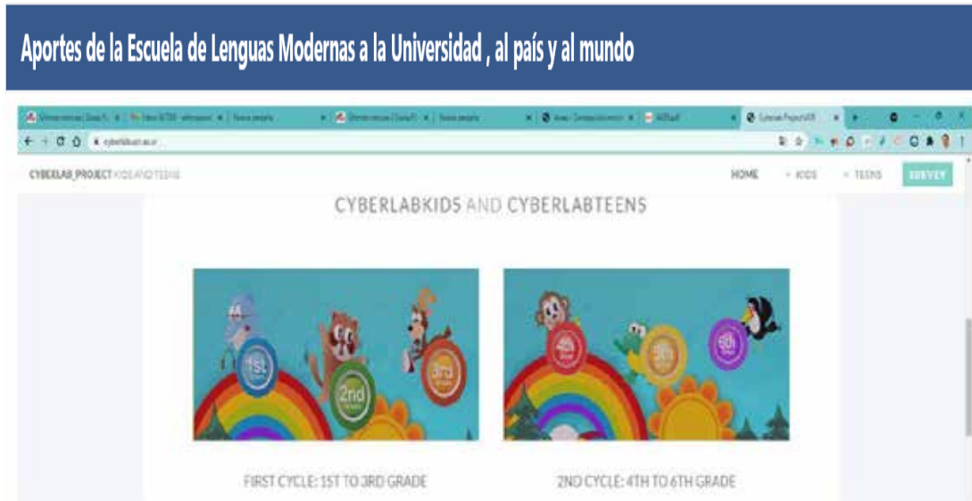
CYBERLABTEENS 10 TH Y 11TH (2017)

Aquí les muestro un ejemplo de cómo se iba creando esto en una plataforma.